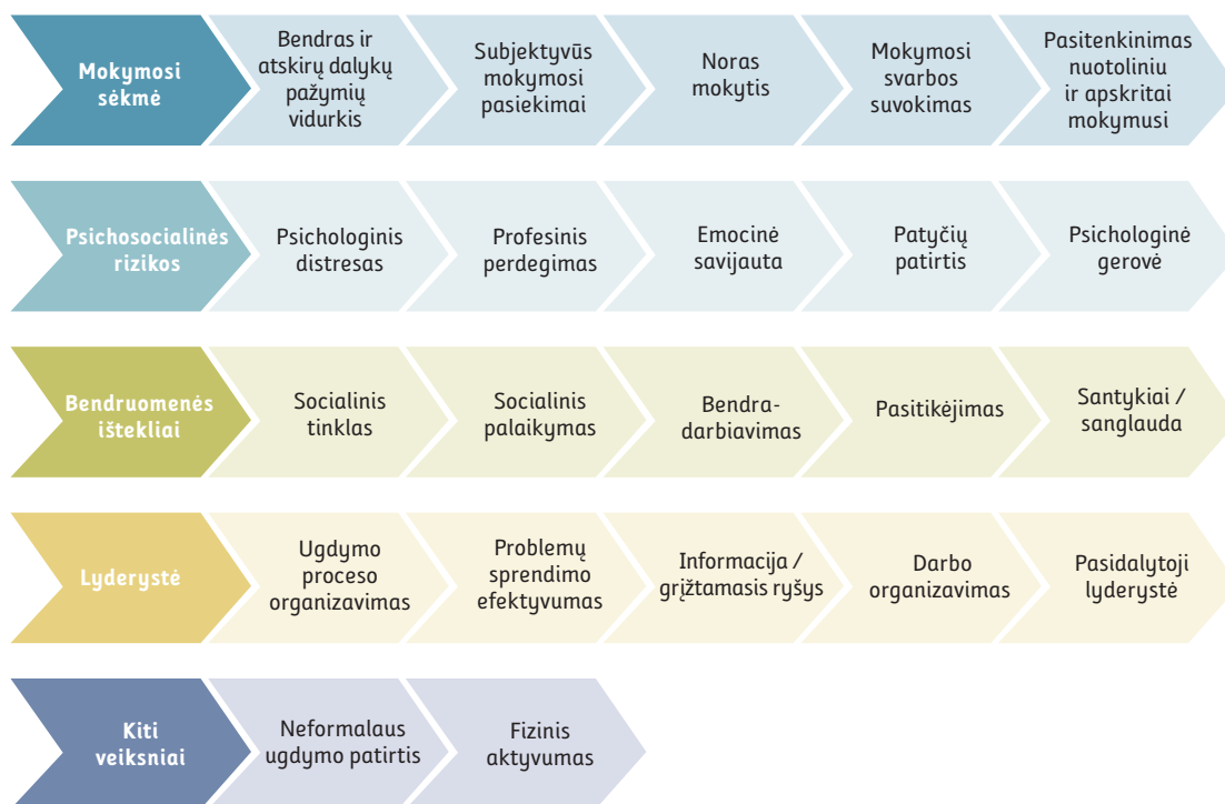
1 pav. Pagrindiniai tyrimo rodikliai

Tyrimas elektroninės apklausos būdu atliktas 2021 m. gegužės mėnesį, tai yra antrojo karantino dėl COVID-19 pandemijos pabaigoje, kai 5–12 klasių mokinių ugdymas nuotoliniu būdu Lietuvoje buvo vykdytas daugiau nei pusę metų.