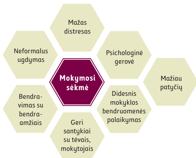
3 pav. Su mokymosi sėkme susiję veiksniai