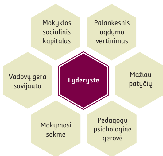
5 pav. Mokyklos vadovų lyderystės sąsajos su mokyklos bendruomenės veiksniais