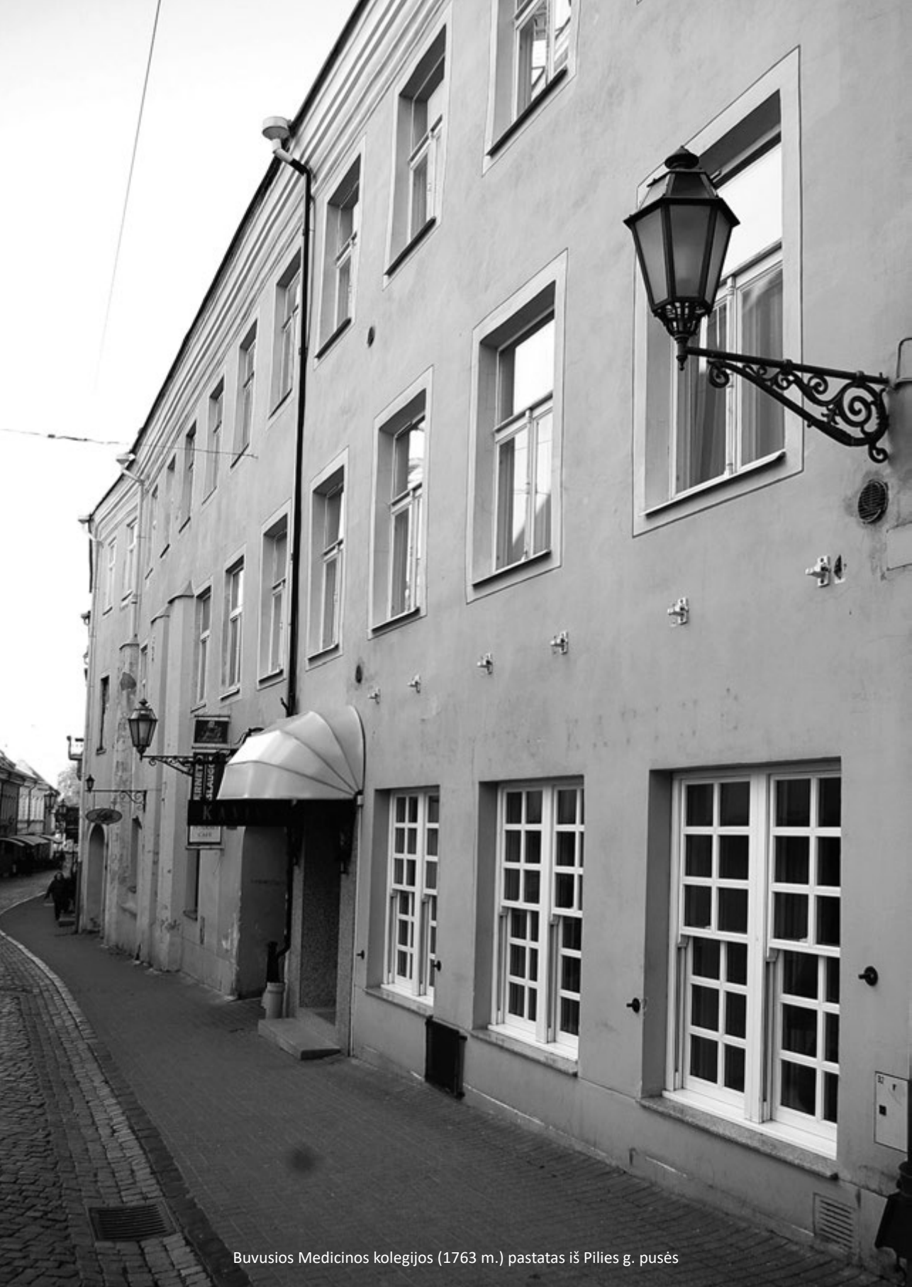
Buvusios Medicinos kolegijos (1763 m.) pastatas iš Pilies g. pusės